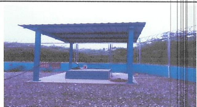
Techado de cisterna