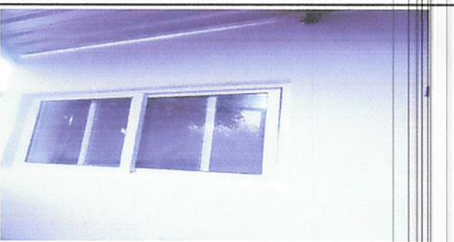
instalación de ventana en cocina

Observación: Si es necesario se pueden agregar hojas adicionales. (Se agregaron 2 hojas.)