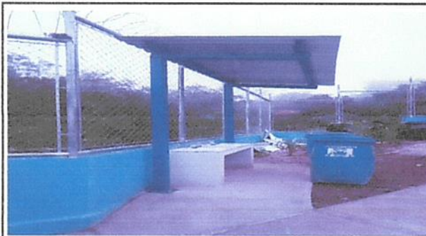
Instalación de techo en lavamanos y colocación de lavamanos