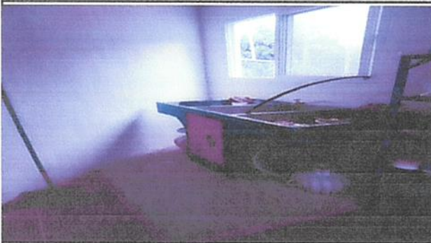
Instalación de pila en cocina