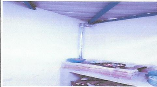
Estufa Rura terminada