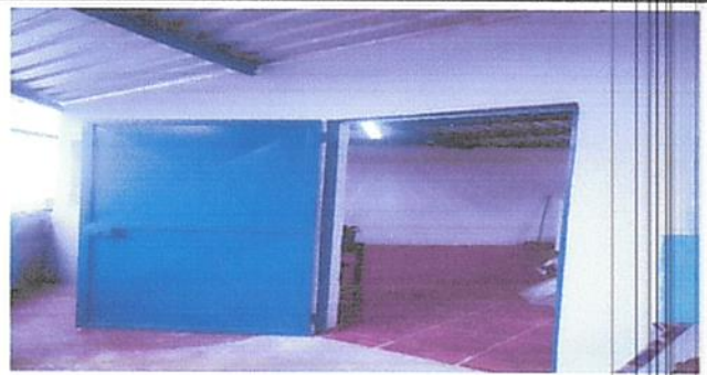
loza de patio y puerta de cocina